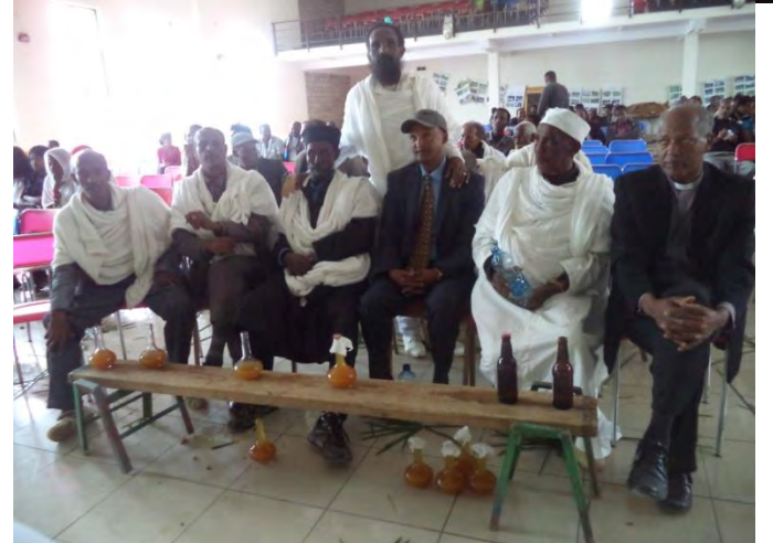
ፈስቲቫል ኣብ ከተማ ዓዲግራት