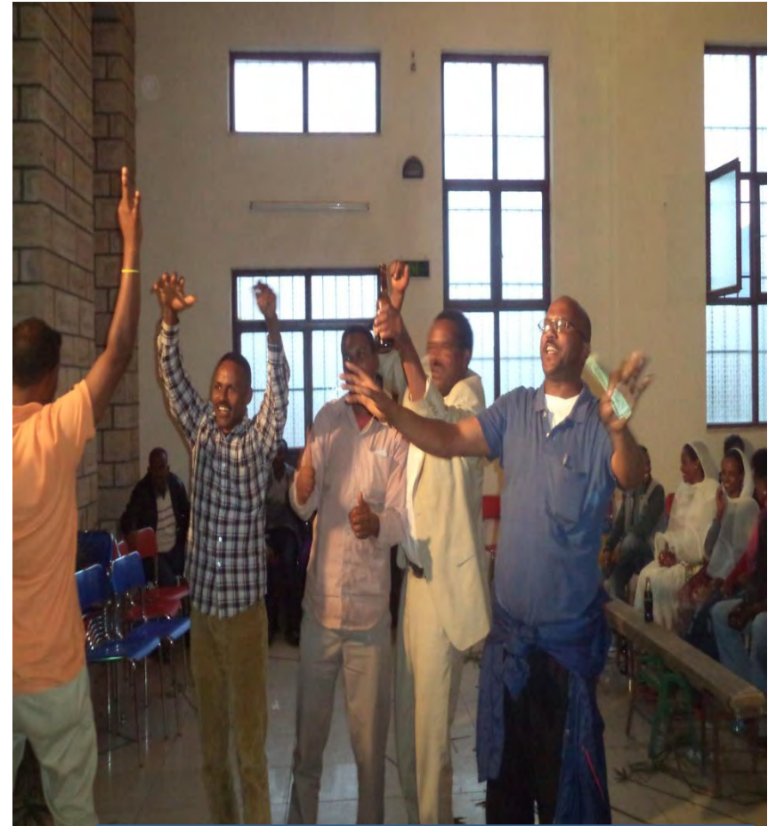
ፈስቲቫል ኣብ ከተማ ዓዲግራት